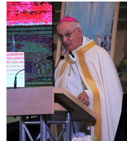
R/ Que le Seigneur nous bénisse tous les jours de notre vie !

Heureux qui craint le Seigneur et marche selon ses voies ! Tu te nourriras du travail de tes mains : Heureux es-tu ! À toi, le bonheur !