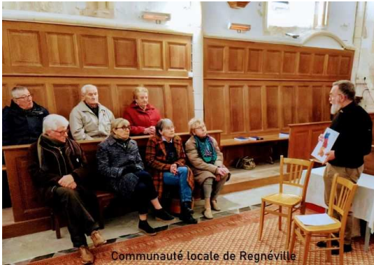
Communauté locale de Regnéville

Ces rencontres du mercredi soir étaient alors l'occasion de lancer la réflexion : Que voulons-nous proposer demain, dans nos villages ? Que voulons-nous vivre ensemble pour que l'Évangile soit visible ? Pour répondre à ces questions, il nous faut tenir ensemble deux attitudes : l'audace de l'Esprit Saint qui suscite des forces nouvelles et le discernement qui prend en compte le réalisme de la situation et de nos forces humaines. Audacieux et réalistes ! Si notre objectif est bien que demain l'Évangile soit vécu et proposé là où nous sommes, alors, je suis certain que Dieu nous donnera ce qu'il faut pour être missionnaires avec audace.