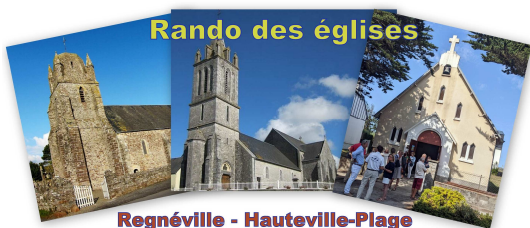
Rando des églises

Rando des églises « Regnéville – Hauteville-Plage », Mardi 18 juillet