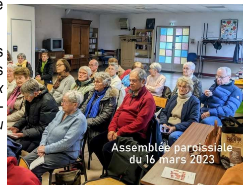
Assemblée paroissiale du 16 mars 2023

* Article rédigé avant la nomination de Mgr Le Boulc'h.