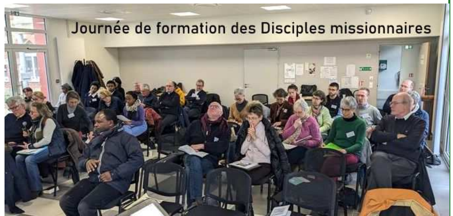
Journée de formation des Disciples missionnaires