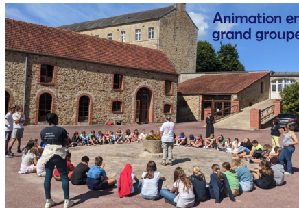
Animation en grand groupe

En cette fin août 2022, l'abbaye de Saint-Sauveur-le-Vicomte résonne de cris et de chants. Plus de 50 jeunes de 6ème des collèges publics de Montmartin-sur-Mer, Agon-Coutainville, Saint-Sauveur-Village et de Coutances, sans oublier ceux du collège Jean-Paul II de Coutances vivent leur retraite de Profession de foi.