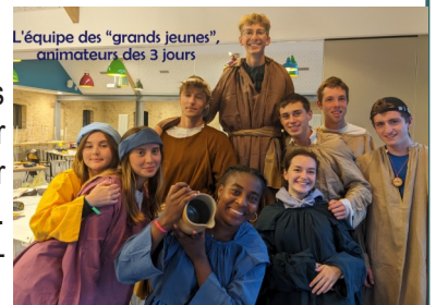
L'équipe des "grands jeunes", animateurs des 3 jours

Samedi 27 août, tous les parents partageaient un grand repas après avoir visité l'abbaye, accueillis et guidés par des religieuses de la communauté. L'eucharistie, célébrée par l'abbé Stanislas Briard clôtura ces belles journées.