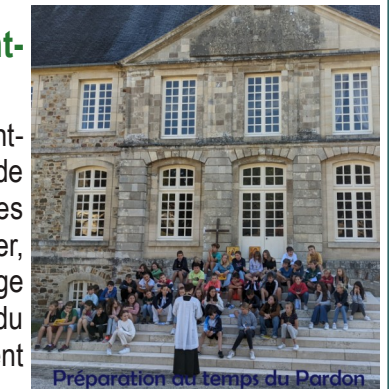
Préparation au temps du Pardon

Temps d'échange et de travail en petits groupes, jeux, bricolage, temps de prière, veillées à thème et moments de détente ont ponctué ces journées, encadrées par des lycéens.