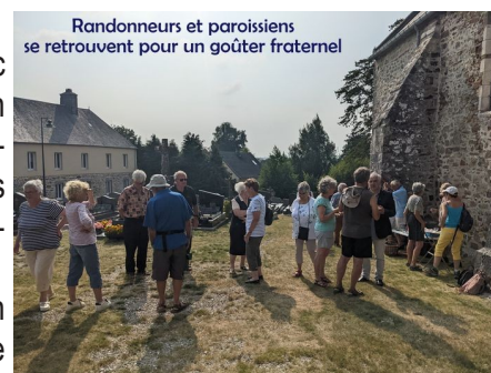
Randonneurs et paroissiens se retrouvent pour un goûter fraternel

Et c'est autour d'un verre de l'amitié que tous se disaient "à l'été prochain !"