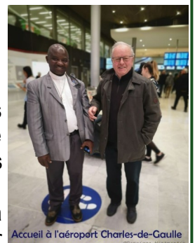
Accueil à l'aéroport Charles-de-Gaulle

Je suis affecté au diocèse de Coutances et Avranches, dans le cadre d'une coopération entre les deux diocèses, sous le mandat missionnaire de « Prêtre Fidei Donum », ce qui signifie « Prêtre donneur de la foi ». Nous pouvons comprendre que je suis au milieu de vous, non pas comme un maître, un professeur mais tout simplement comme un témoin de la foi. Evidemment, comme témoin de la foi, je ne suis pas là pour construire des églises mais pour construire des cœurs pour l'Eglise.