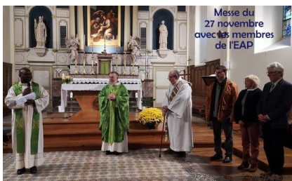
Messe du 27 novembre avec les membres de l'EAP

Après une année de pause qui m'a conduit notamment au Liban, j'ai été nommé responsable de la formation des prêtres et des laïcs dans le diocèse tout en enseignant à Caen à l'Institut Normand de Sciences Religieuses qui forme les laïcs qui travaillent dans l'Eglise. Ma particularité, au-delà de la place importante de l'enseignement dans ma vie de prêtre, est d'avoir été baptisé dans une Eglise catholique orientale : unie à Rome, cette