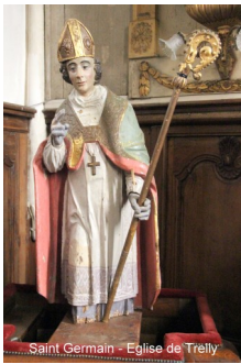
Saint Germain - Eglise de Treilly

Une Rando des églises est proposée, mardi 19 juillet, de Treilly à Contrières. Nous vous donnons rendez-vous à 14h30 près de l'église Saint Germain de Treilly (13ème siècle) puis nous emprunterons des petites routes, accessibles à tous, jusqu'à Contrières (8 kms environ). Une visite commentée de l'église (11ème siècle), dédiée à Sainte Marguerite (martyrisée au 3ème siècle) sera suivie d'un goûter offert aux randonneurs et aux membres de la communauté paroissiale qui les rejoindront pour la célébration qui clôturera cette