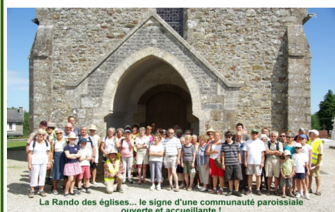
La Rando des églises... le signe d'une communauté paroissiale ouverte et accueillante !

page 12 - Dons à la paroisse - Denier de l'Église