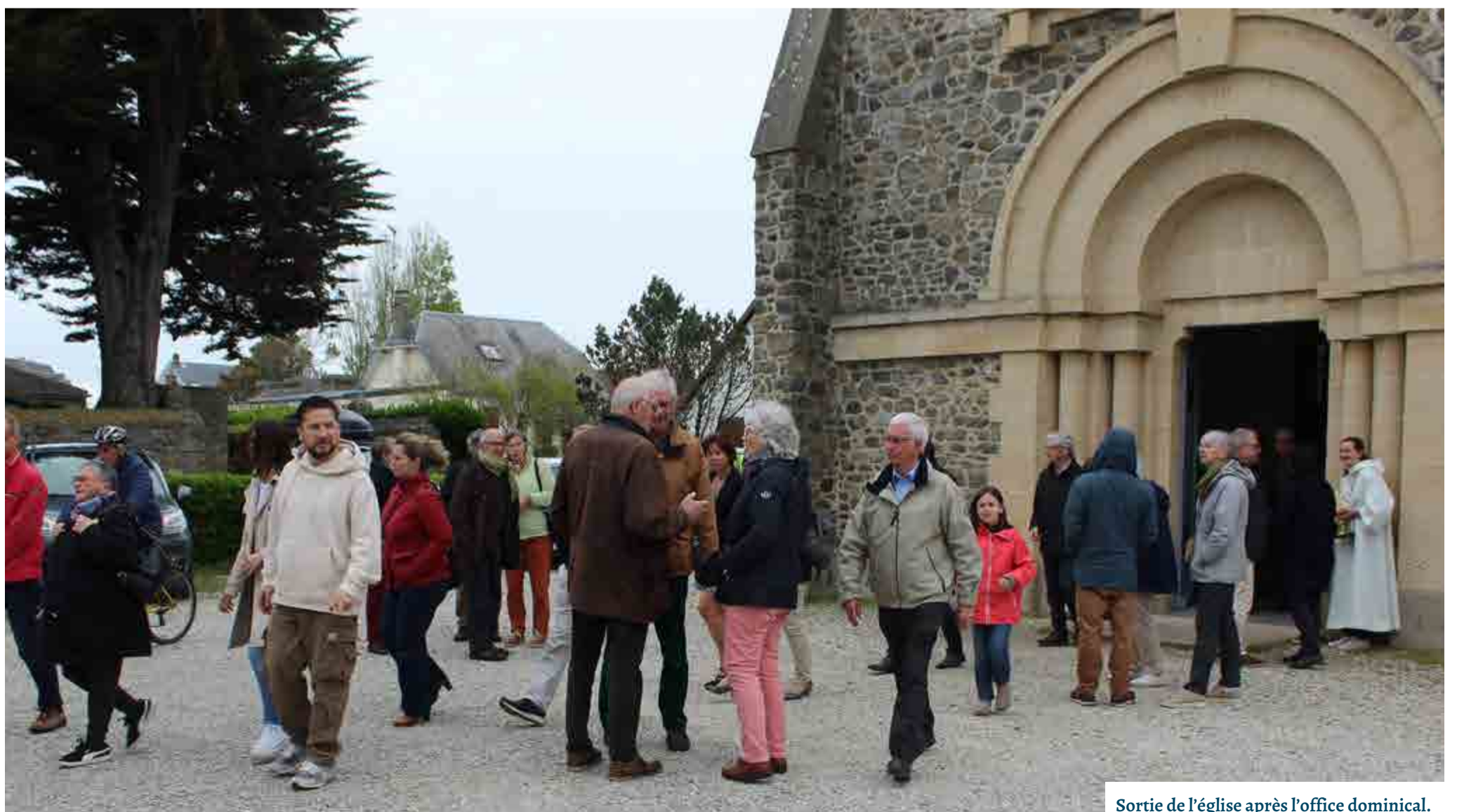
Sortie de l'église après l'office dominical.

PROPOS RECUEILLIS PAR JEAN-PIERRE DUBOIS