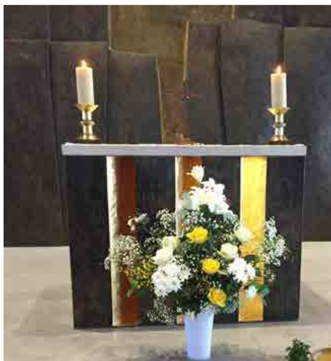
Une composition florale réussie orne l'autel.