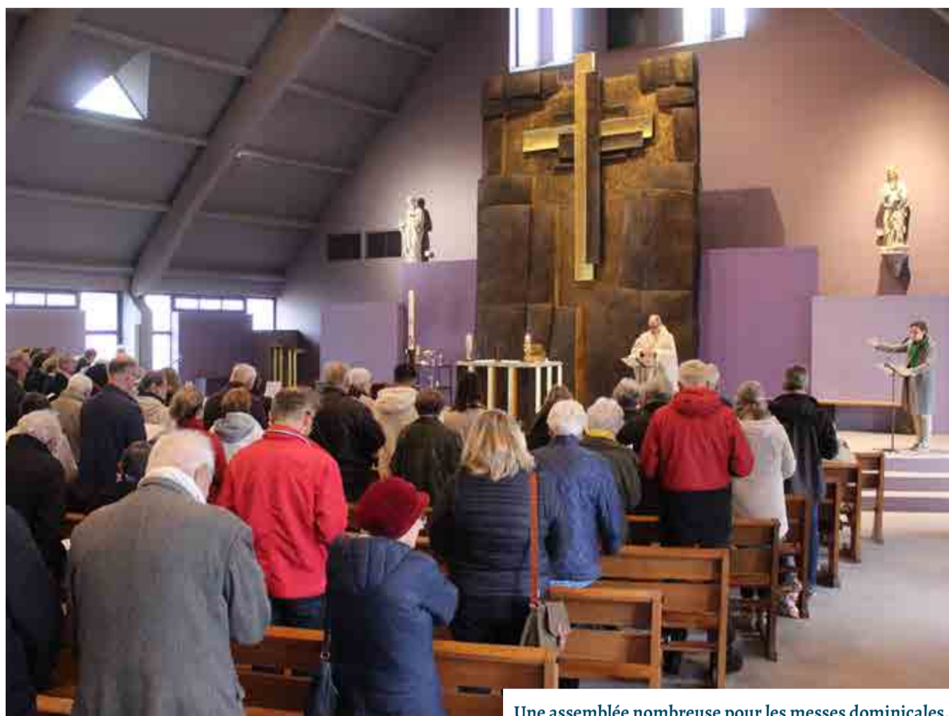
Une assemblée nombreuse pour les messes dominicales.

En pénétrant dans l'église, je suis accueillie par une ou plusieurs personnes qui me saluent cordialement, me gratifiant d'un large sourire.”