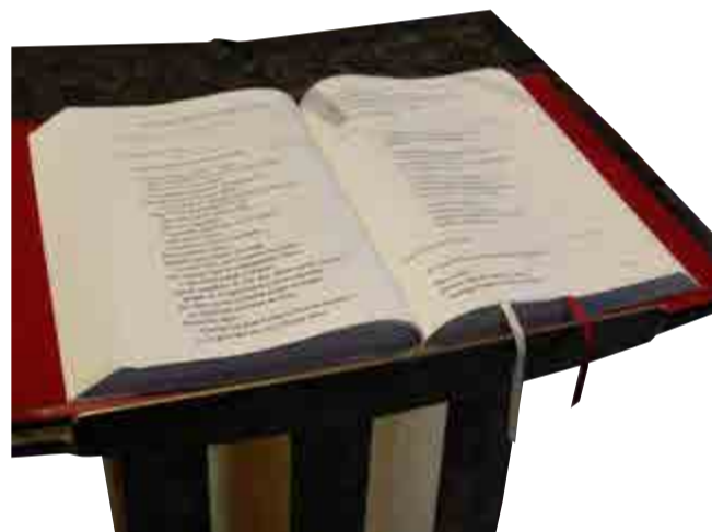
Le lectionnaire déposé sur l'ambon.