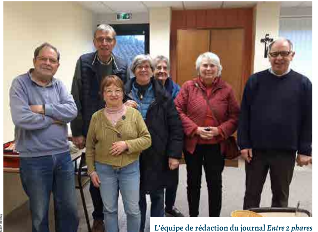
L'équipe de rédaction du journal Entre 2 phares

Nous sortons le premier numéro du nouveau journal Entre 2 phares (titre trouvé par le père Pascal, il y a un phare à chaque extrémité de la paroisse). Avec l'aide d'un journaliste, je vais aller dans chaque commune pour mettre en place une équipe de diffuseurs soit