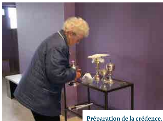
Préparation de la crédence.