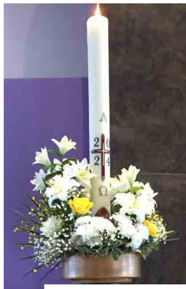
Le cierge pascal, lui aussi, a bénéficié d'une belle composition florale.

PROPOS RECUEILLIS PAR CHRISTIANE AUDIC, CLAIRE BOIVIN, MONIQUE COCHEPAIN ET FRANÇOISE LECOURTOIS