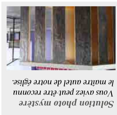
Solution photo mystère Vous aviez peut-être reconnu le maître autel de notre église.

Horizontalement : I. Jeuxolympiques. II. Up. Bi. Allure. III. Salle. Sta. Aeres. IV. Turtus. Ecole. Ne. V. Al. Centre. Sto. VI. Ve. Al. Effort. VII. Princes. Io. VIII. Or. Elle. Craie. IX. Robes. Clament. X. Puc. Ar. Oter. XI. Stem. Ducat. Ins. XII. Ih. Piolet. XIII. Decathlon. Non. XIV. Record. Eu. Unss. XV. Pese. Tentee. Verticalement : I. Justaucorps. 2. Epaulé. Routière. 3. Lt. Beches. 4. Lucarne. Ace. 5. Obese. Sa. Croe. 6. Li. Ne. Td. Hr. 7. Tacle. Id. 8. Materiel. Wc. 9. Place. Sec. Apnee. 10. Il. Loti. Un. 11. Qualification. 12. Uree. Forme. Loue. 13. Er. So. Aertenne. 14. Entrain. Nt. 15. Ascot. Eres. Psg.