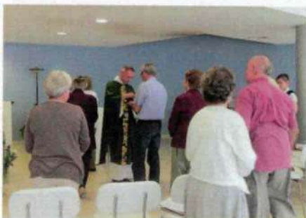
Lieu de culte de l'Hôpital Pasteur