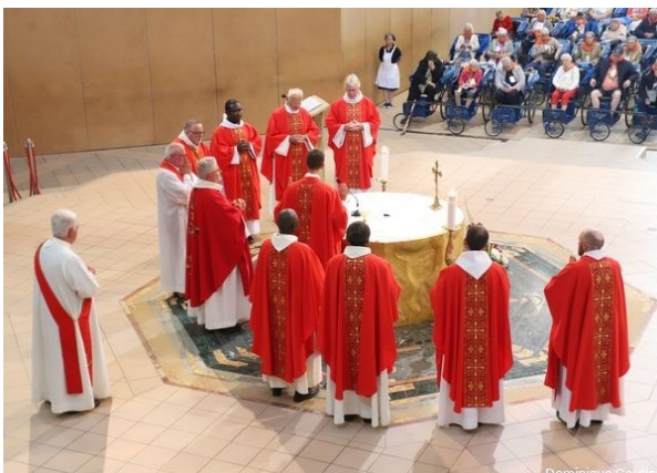
Souvenirs de Lourdes 2024