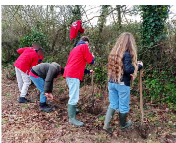
Nous avons travaillé notre planté de bâton