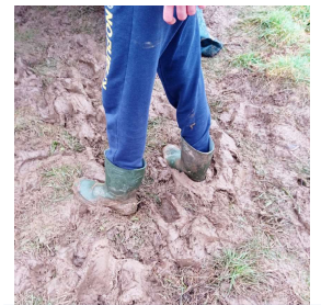
Promenade dans la poudreuse fondante !