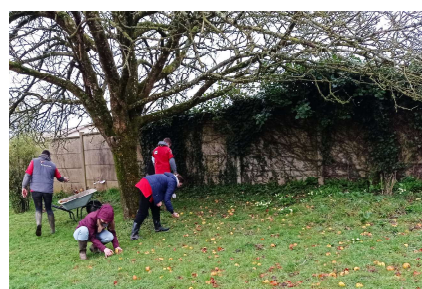
Bataille de boules pourries