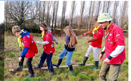
Epreuve de ski de fond sur les pistes enherbées et transport en commun local