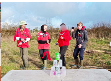
Nous avons relevé les nombreuses épreuves du Boulethlon organisé pour le Thinking Day