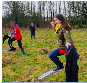
Nous avons testé la raquette normande...