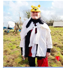
Il fallait mieux s'habiller chaudement