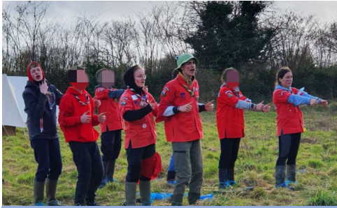
Après un bon repas nous nous sommes échauffés avec "Les pouces en avant" !

Samedi 22 et dimanche 23 mars, les Boulets Rouges ont enfilés leur bottes et combinaison étanche pour se rendre au Val Tordu, petite station hivernale de Reigneville-Bocage... en Normandie !