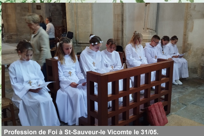
Profession de Foi à St-Sauveur-le Vicomte le 31/05.