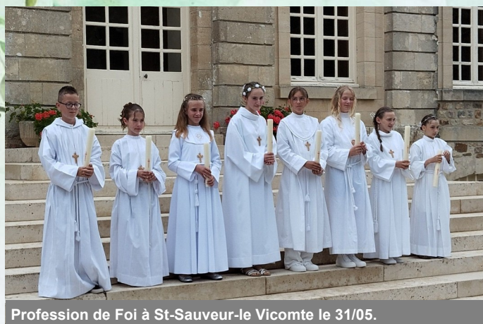
Profession de Foi à St-Sauveur-le Vicomte le 31/05.