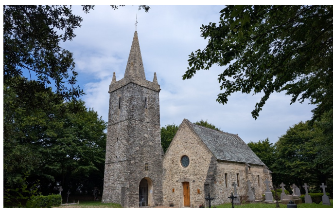
La chapelle Saint-Louis