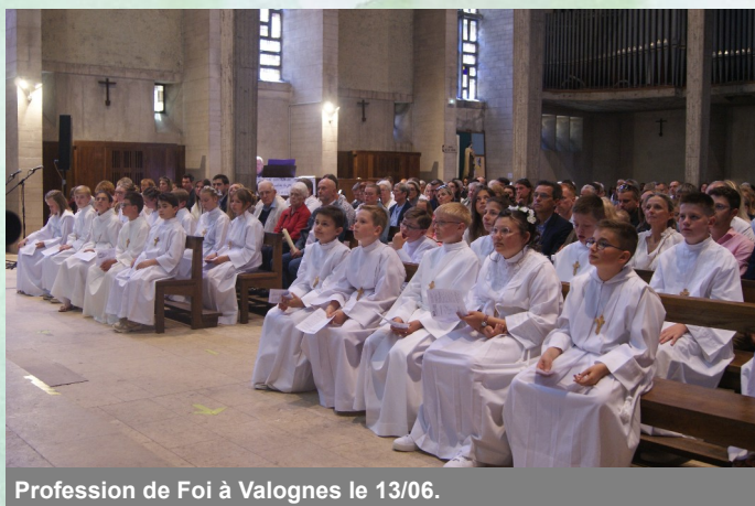
Profession de Foi à Valognes le 13/06.