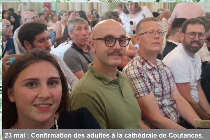
23 mai : Confirmation des adultes à la cathédrale de Coutances.