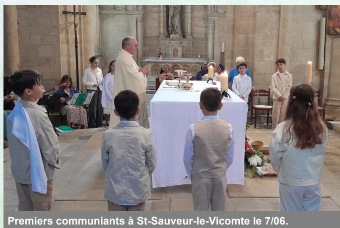
Premiers communiant à St-Sauveur-le-Vicomte le 7/06.