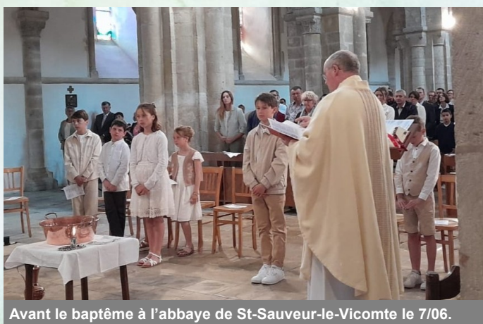
Avant le baptême à l'abbaye de St-Sauveur-le-Vicomte le 7/06.