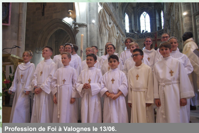
Profession de Foi à Valognes le 13/06.