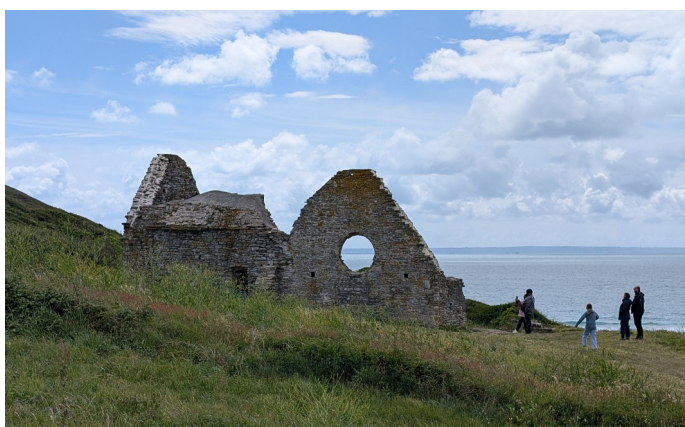
La Vieille Église Saint-Germain