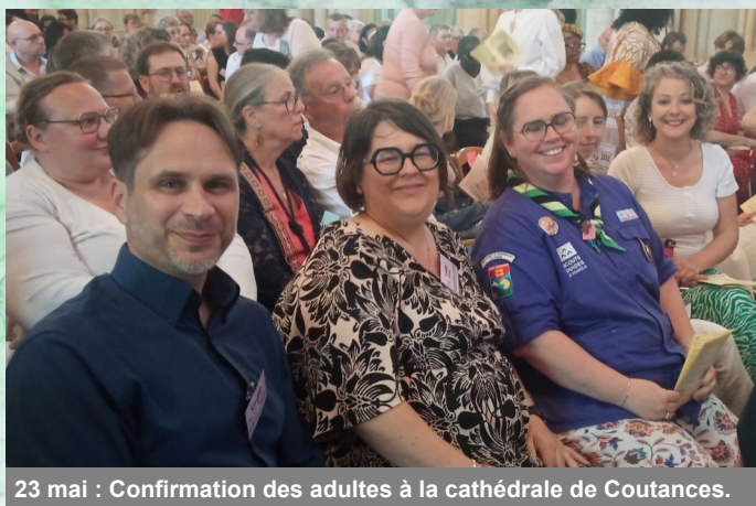
23 mai : Confirmation des adultes à la cathédrale de Coutances.