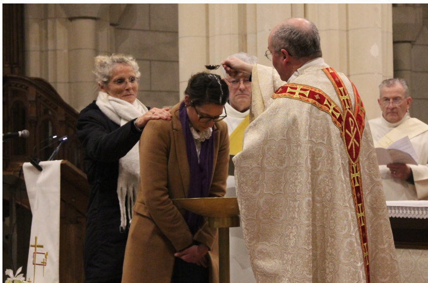
Baptême d'adulte pendant la veillée pascale à Bricquebec.