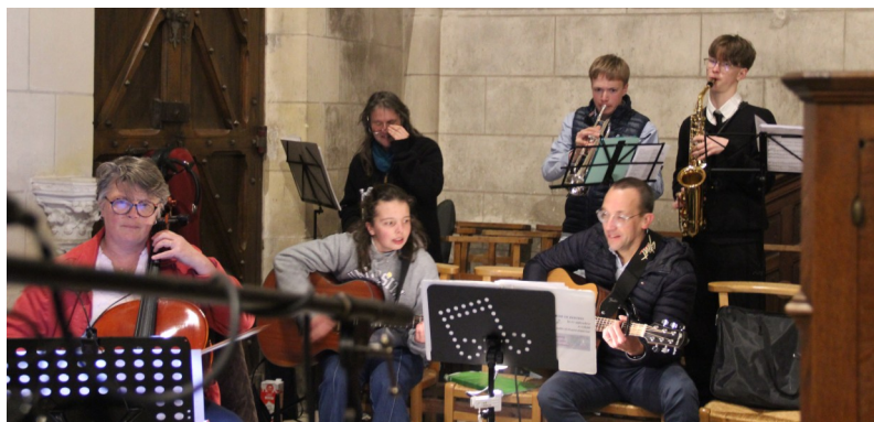
Groupe des musiciens qui ont accompagné la veillée pascale 2026