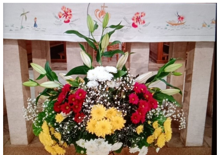
Bouquet des sœurs de Sainte-Marie-Madeleine-Postel.

Responsable de la rédaction : Père Philippe NAVET - 6, place du Puits-Artésien 50700 VALOGNES - saintgermain@paroisse50.fr