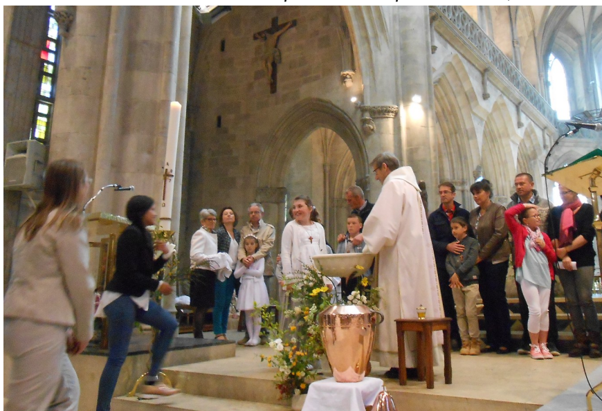
Baptêmes d'enfants d'âge scolaire pendant le temps pascal

Propos recueillis par Catherine, catéchiste