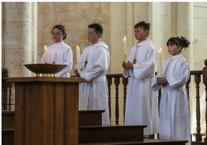
L'aube blanche lors de la profession de Foi