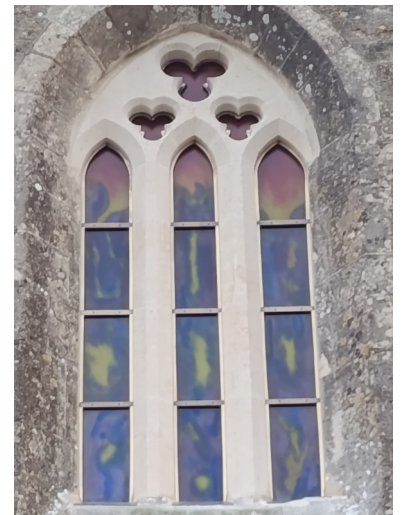
Extérieur du vitrail de Saint-Floxel avec la maçonnerie restaurée.