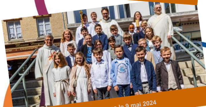
Première Communion à Valognes le 9 mai 2024