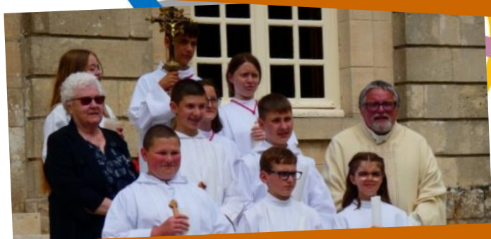
St-Sauveur le Vicomte, Profession de Foi le 8 juin 2024