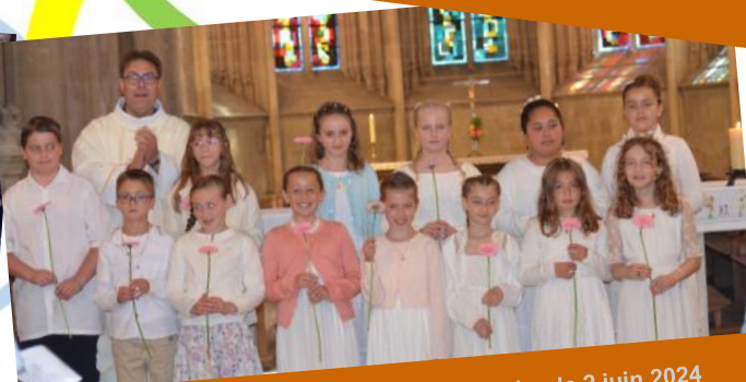
St-Sauveur le Vicomte, Première Communion le 2 juin 2024