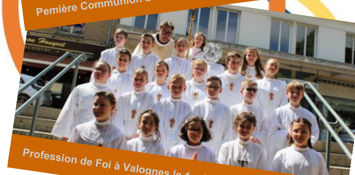
Profession de Foi à Valognes le 1er juin 2024