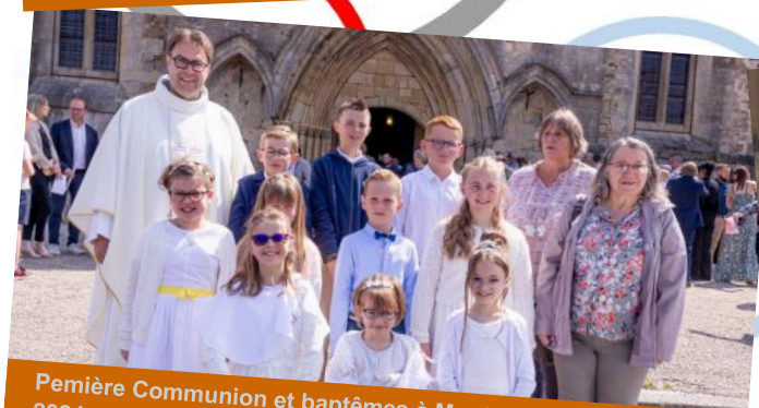
Première Communion et baptêmes à Montebourg le 12 mai 2024