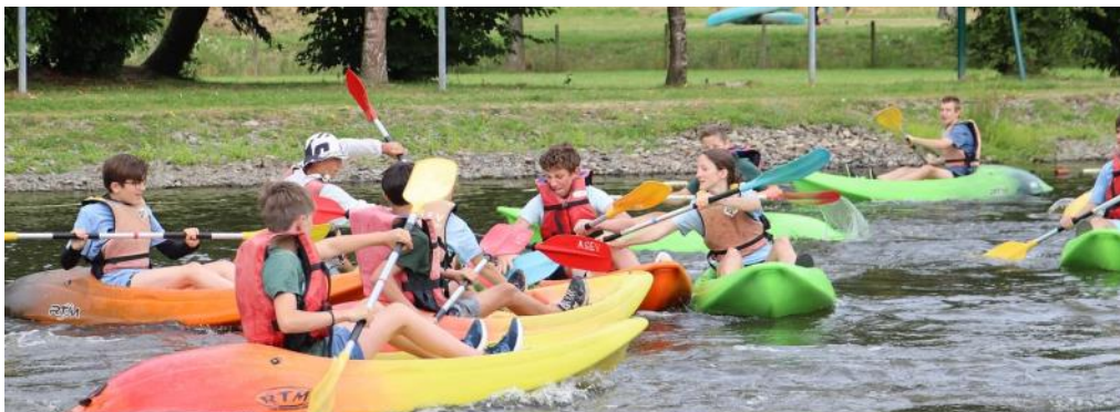
Pendant le match de kayak polo

« Les jeunes du doyenné de Valognes, accueillant dans l'équipe trois jeunes de Saint-Lô, ont fait preuve de force, de bienveillance, d'habileté et d'audace. »