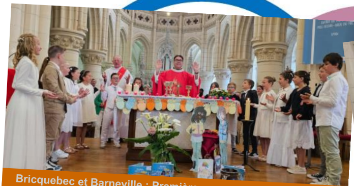
Bricquebec et Barneville : Première communion le 19 mai 2024