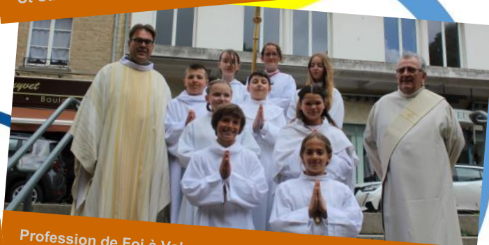
Profession de Foi à Valognes le 26 mai 2024