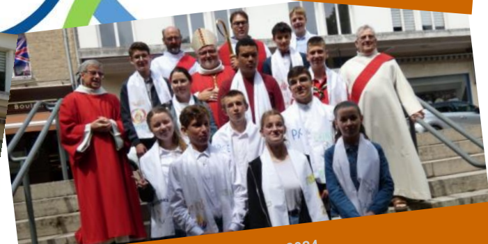
Confirmation à Valognes le 16 juin 2024