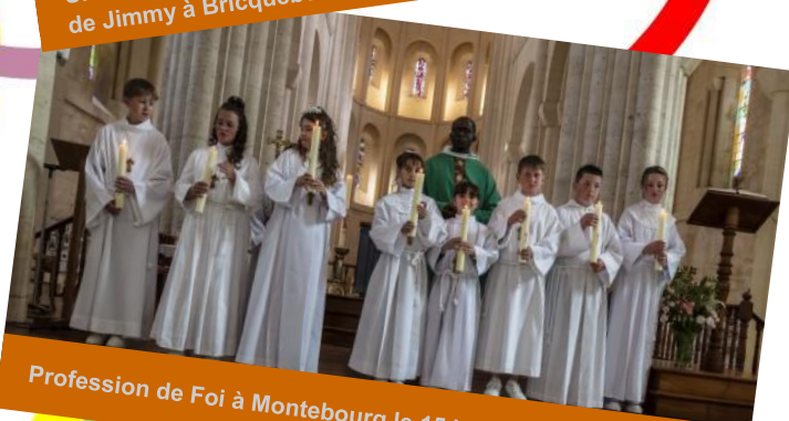
Profession de Foi à Montebourg le 15 juin 2024