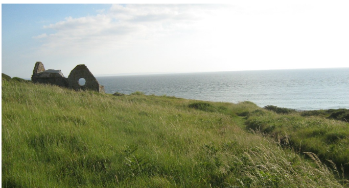
La vieille église Saint-Germain de Carteret, voisine du "trou au serpent" et de la fontaine guérisseuse.

Présenté comme le fils d'un prince de la nation Scot nommé Audin, le jeune Germain aurait été baptisé par l'évêque Germain d'Auxerre, lors d'une mission menée par ce dernier en Grande-Bretagne. Ayant atteint l'âge adulte et désireux de rejoindre son parrain, il serait parvenu à traverser la mer sur une roue de char (!). Parvenu sur le rivage des Gaules, il y aurait affronté un juge païen puis, à l'incitation d'un préfet militaire, vaincu un Dragon à sept têtes, qu'il lia avec son étole et projeta dans un puits. Renonçant à énumérer les statues et les temples païens que Germain détruisit, le narrateur évoque ensuite son voyage à Trèves, auprès de saint Sever, qui le reçut à la dignité épiscopale. Après avoir également séjourné en Espagne et à Rome, Germain serait revenu une deuxième fois sur le continent. Il aurait cette fois-ci débarqué au port de Mogdunum , guéri en ce lieu la fille d'un notable, incité les populations à l'abandon de l'idolâtrie, suscité la construction d'églises.