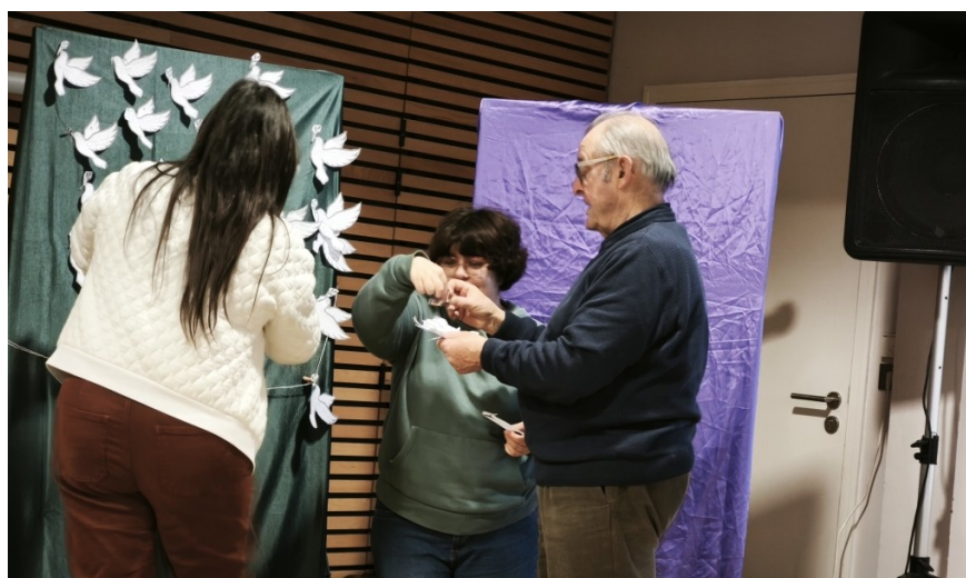
Derniers préparatifs pour fête Noël 2025, en équipe.