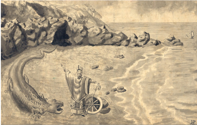
"Saint Germain de la Mer combattant le dragon du trou Baligan", dessin au crayon signé HP, Valognes (médiathèque J. de Laillier)

Chacun a entendu parler de saint Germain de la Mer, dit aussi Germain le Scot ou Germain à la roue.