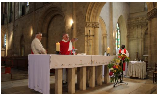
Messe à l'abbaye de St-Sauveur