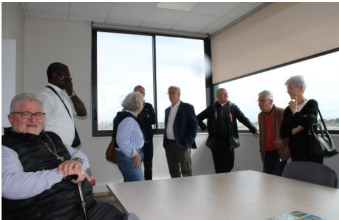
A la capitainerie du port de Barneville-Carteret