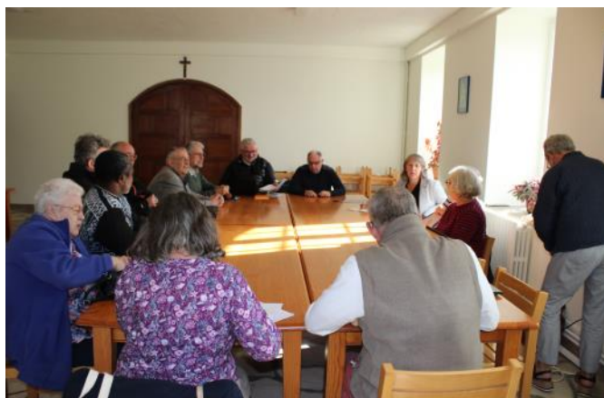
A l'abbaye de Bricquebec avec l'EAP des 5 paroisses