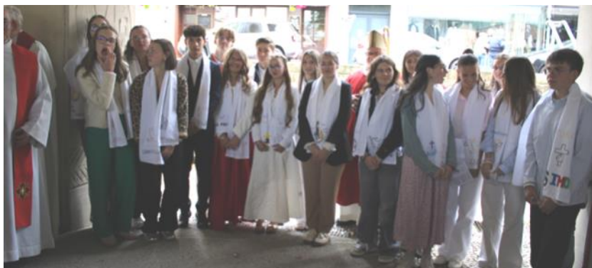
A la sortie de la Confirmation du 21 septembre

Nombreux exposants Restauration sur place