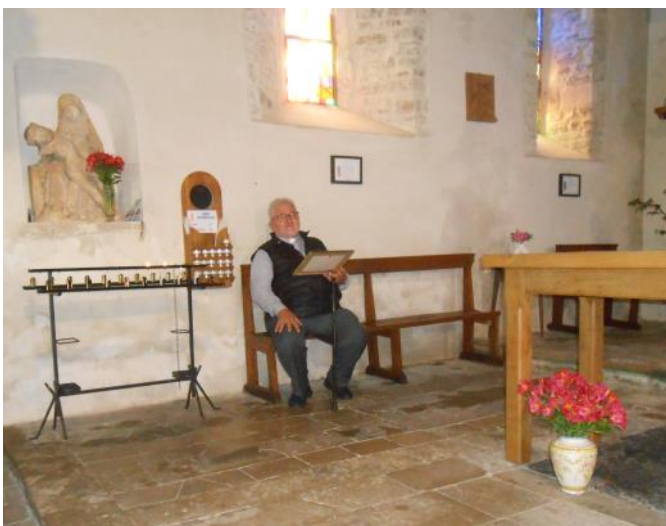
Halte à la chapelle St-Siméon de Portbail