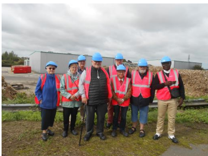
Visite du site de traitement des déchets au Ham