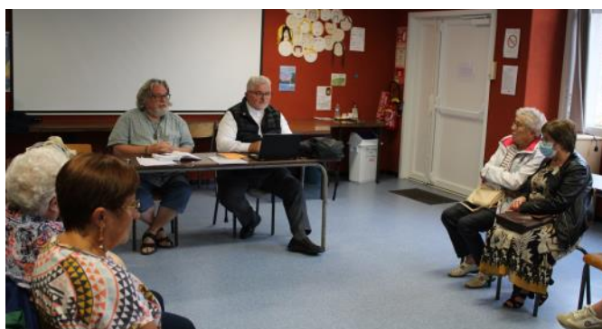
Avec les différents acteurs de nos paroisses à l'Oasis