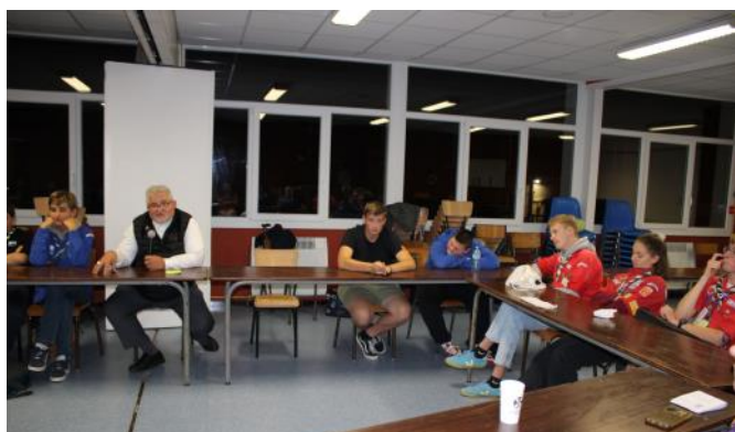
Avec les jeunes à l'Oasis