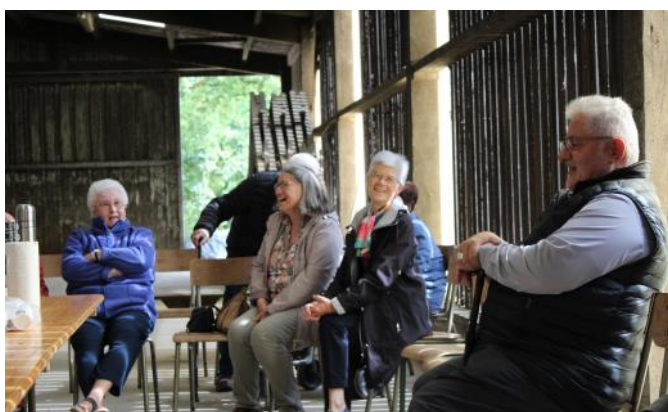
Visite d'une ferme à Besneville