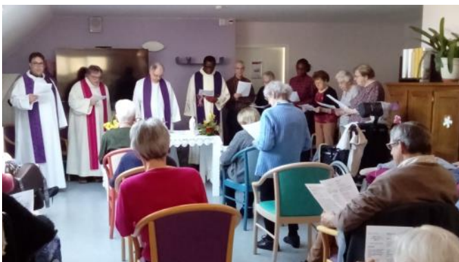
Messe à l'EHPAD des Lices lors de la mission de Saint-Sauveur en mars 2023.