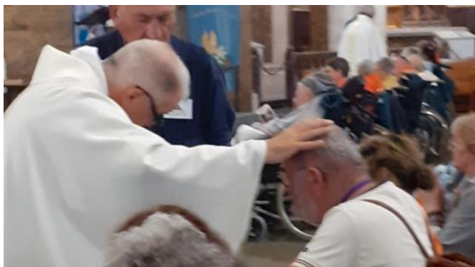
Sacrement de l'onction des malades à Lourdes en 2023