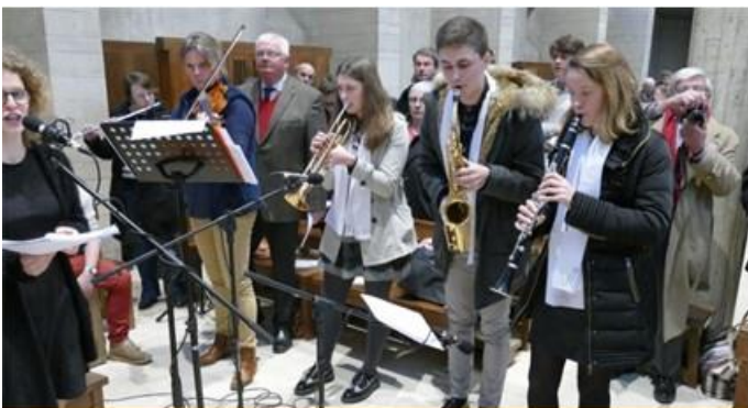
Groupe de musiciens de Valognes

Ce groupe de musiciens de Valognes s'est constitué vers les années 2012.