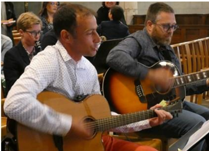
Une partie du groupe de musiciens de Sainte-Marie-Madeleine-Postel lors d'une célébration

Lors des messes d'enfants animées par l'école Notre-Dame, des premières communions ou des professions de Foi, quelques musiciens du groupe de Saint-Sauveur-le-Vicomte viennent embellir ces célébrations.