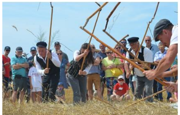
Battage du blé par les « battous »

Comme chaque année, au début du mois d'août, la Fête de la Terre, à Portbail, s'est déroulée sous un beau soleil dans un grand champ de blé, avec à l'horizon la mer et les îles Anglo-Normandes.