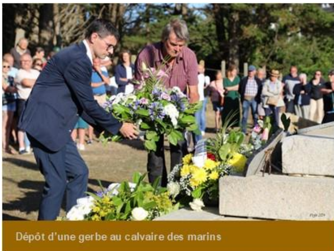
Dépôt d'une gerbe au calvaire des marins

La fête de la mer, à Carteret, reste toujours un événement important qui permet aux locaux, mais aussi aux estivants, de se retrouver et de vivre une journée joyeuse à travers un programme riche en activités diverses.