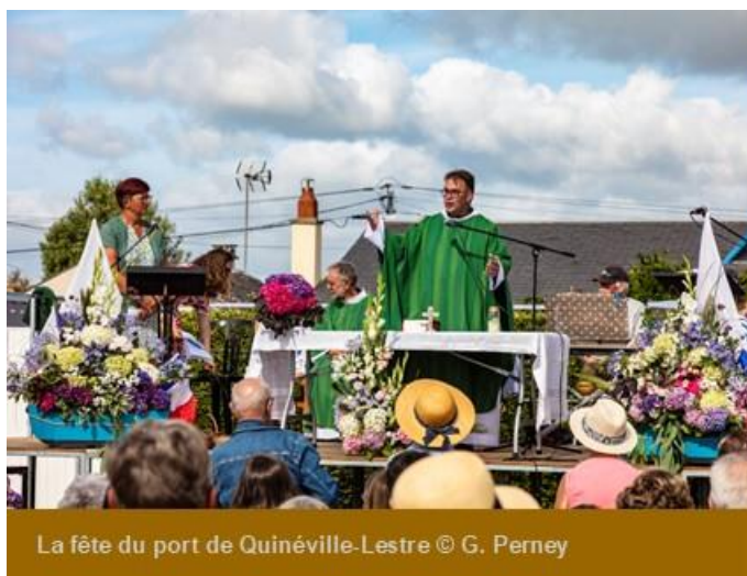
La fête du port de Quinéville-Lestre

Le 4 août était jour de fête au petit port de la Sinope situé sur les communes de Lestre et Quinéville.