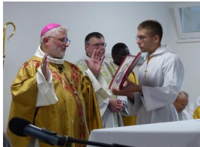
Pendant la messe