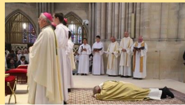
Prostration pendant la litanie des saints