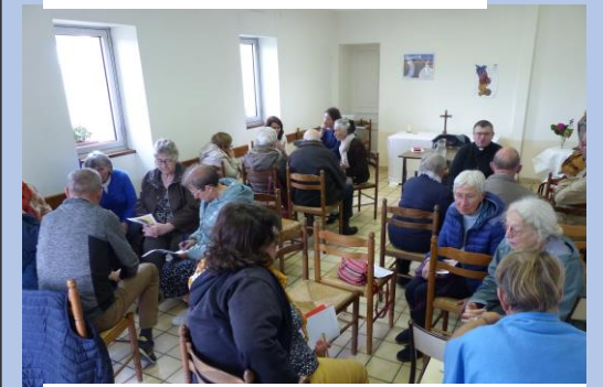
Partage en petits groupes