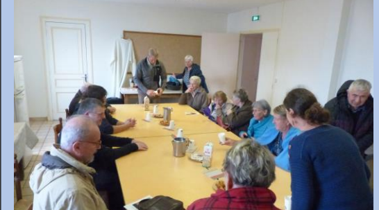
Réconfort autour d'un café bien chaud