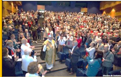
Chaude ambiance dans le théâtre

Retrouvez les meilleurs moments de l'ordination épiscopale de Mgr CADOR en cliquant sur le lien ci-joint https://youtu.be/MKT1owJJhtw et les photos sur https://www.diocese50.fr/albums-photo/ordination-episcopale-de-mgr-gregoire-cador/