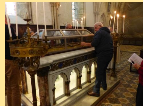
Ostention des reliques