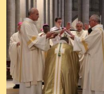
Remise de l'évangélaire