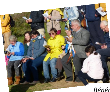
Bénédictio et envoi au calvaire des dunes