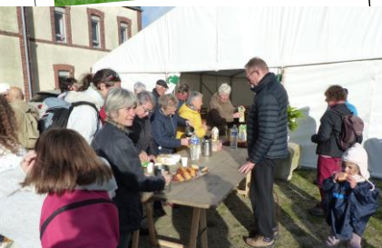
Arrivée au centre : le réconfort