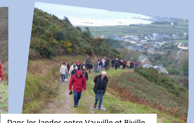
Dans les landes entre Vauville et Biville