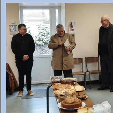
Lors du goûter nous avons offert un livre sur la Hague à notre évêque