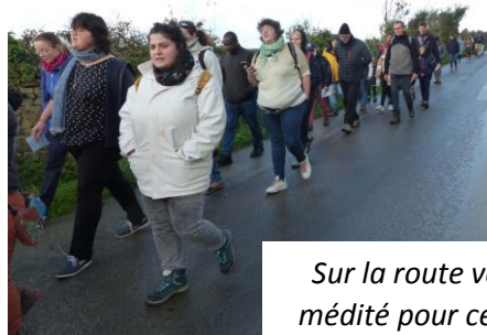
Sur la route vers Biville, chapelet médité pour ceux qui le souhaitent