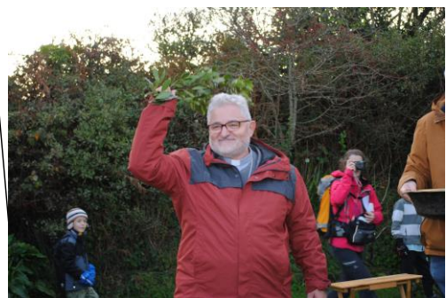
Liturgie baptismale à la fontaine du Bienheureux