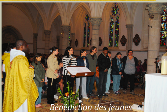
Bénédiction des jeunes