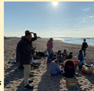
Pique-nique à Cosqueville