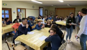
Pendant la retraite à Cosqueville

C'est mon meilleur ami, il m'aide dès que j'ai besoin de lui, à chaque événement, à chaque choix, il est là