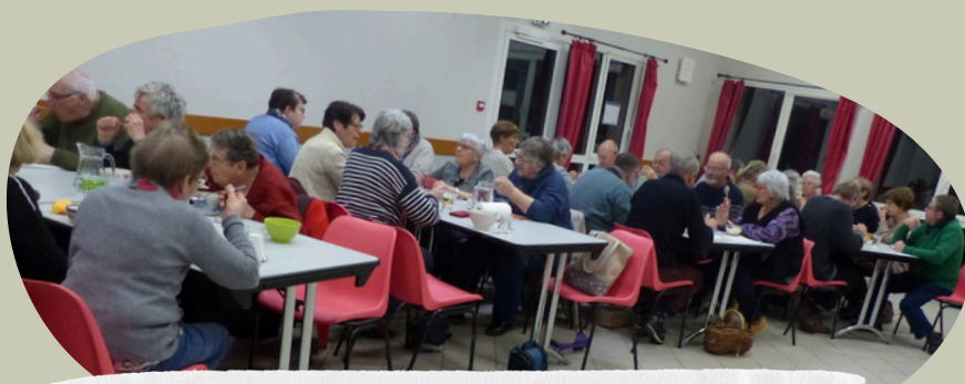
Merci à toutes celles et ceux qui ont participé