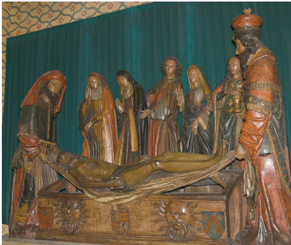
Moissac : « Mise au tombeau ». Picasso

Pas de pression donc, et nous pouvons de ce fait consacrer du temps aux familles des défunts. Ces rencontres sont vraiment le cœur de notre service : il s'agit d'y offrir cette écoute attentive et empathique dont ont besoin les