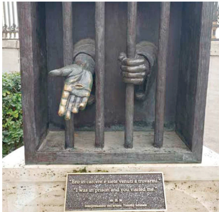
Sculpture du jardin de Saint-Paul-hors-les-Murs à Rome, illustrant l'Evangile selon saint Matthieu 25, 36 : « J'étais en prison, et vous êtes venus jusqu'à moi ».