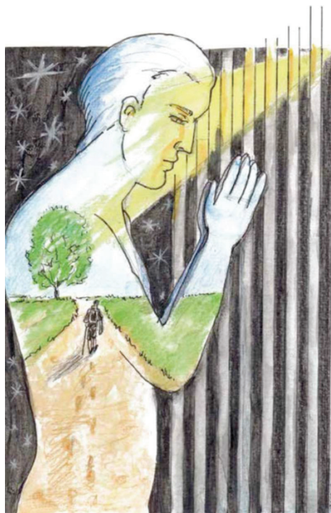
Un dessin d'un détenu.