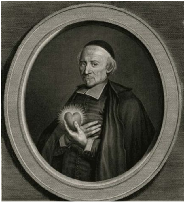
Portrait de saint Jean Eudes.

JEAN EUDES est né le 14 novembre 1601 à Ri, près d'Argentan dans l'Orne. Ses parents avaient invoqué la Vierge Marie pour avoir un enfant et ils firent un pèlerinage à Notre Dame de la Recouvrance lorsque l'enfant s'annonça et ils le consacèrent au Seigneur et à Notre-Dame. Jean eut deux frères et quatre sœurs. Il passa son enfance à la campagne. C'était un enfant au caractère doux, à l'intelligence vive et à la piété précoce. À quatorze ans, il fut confié aux Jésuites de Caen. Il obtint de brillants résultats. Au cours de l'année de philosophie, il perçut clairement l'appel au sacerdoce. Lors des études à la Faculté de théologie de Caen (1621-1623), il comprit que Dieu l'appelle à la vie religieuse. À Caen se trouvait une maison de l'Oratoire, institué fondé à Paris par Pierre de Bérulle en 1611. Très édifié par la ferveur des oratoriens, Jean rejoignit leur communauté puis partit à Paris