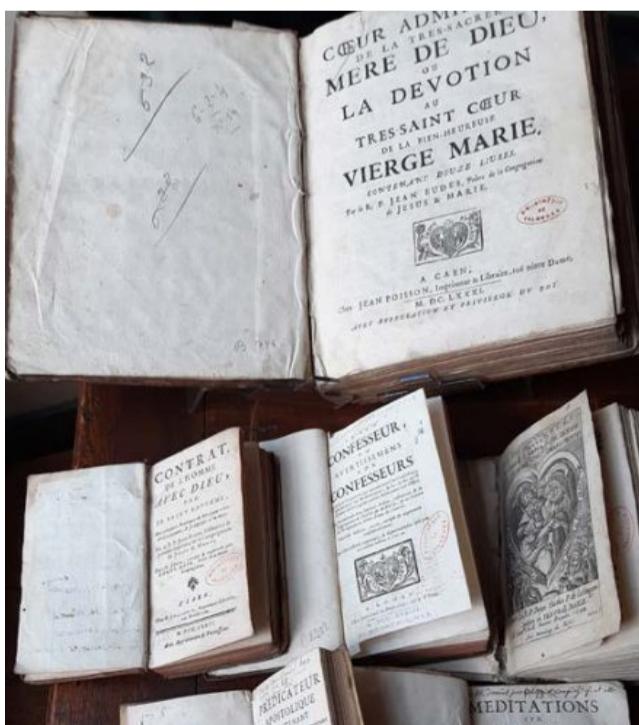
Ouvrages du Père Jean Eudes conservés à la bibliothèque de Valognes.

• 29 novembre 2025 / 24 janvier 2026 / 21 mars 2026 : Formation « Eglise en mission » à la salle Briovère à Saint-Lô de 9h30 à 16h30. Cette formation se déroule sur 2 ans à raison de trois samedis par an. Les participants s'engagent à participer à l'ensemble des trois journées de l'année. Cette formation a pour but de soutenir la transformation pastorale des paroisses. Informations supplémentaires et inscriptions : diocese50.fr/agenda ou 02 33 76 70 70.