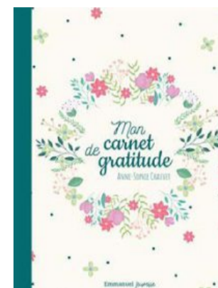
Pour les 12-14 ans : Mon carnet de gratitude (Ed. Emmanuel).