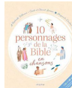
Pour les tout-petits : 10 personnages de la Bible en chansons (Ed. Mame).