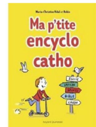
Pour la première communion : Ma p'tite encyclo catho (Ed. Bayard). DR