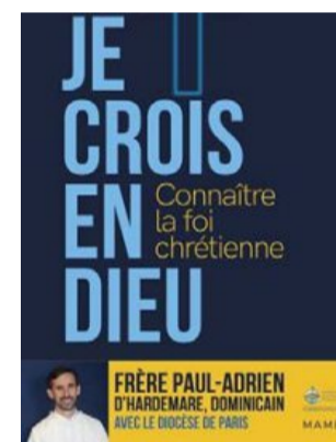
Pour la confirmation : Je crois en Dieu (Ed. Mame).