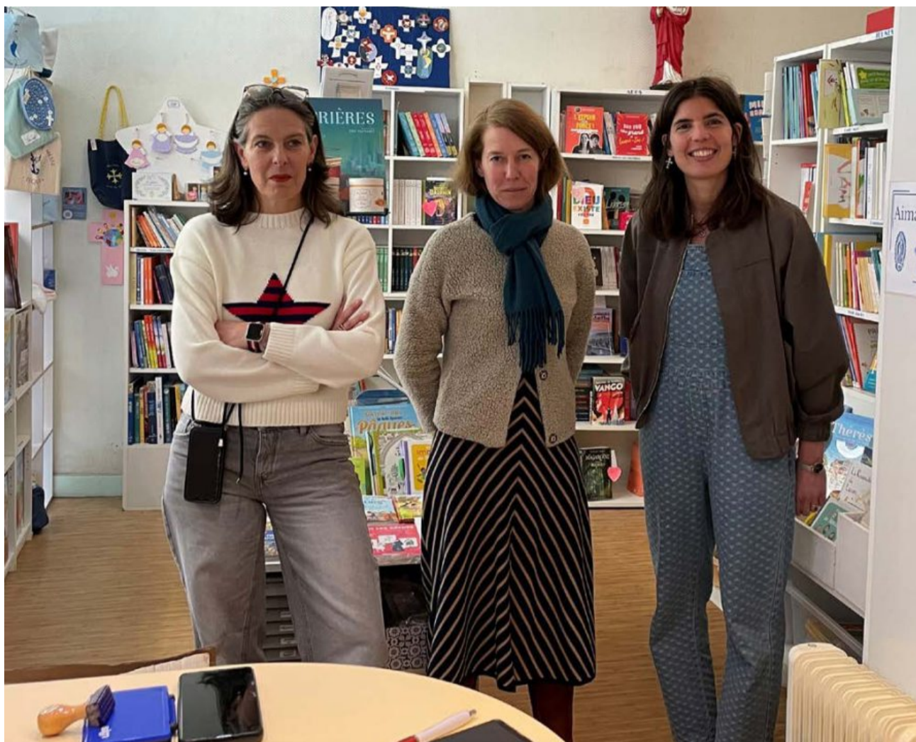
L'équipe de la librairie Siloë de Cherbourg.

• 10 personnages de la Bible en chansons (Ed. Mame) : un livre joliment illustré à l'aquarelle et contient, en plus des paroles des chansons, la mini-biographie et une citation de chaque personnage.