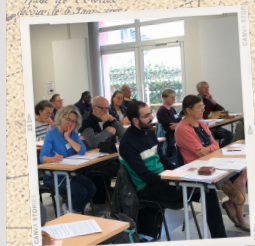
Week-end école des disciples missionnaires