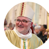
Grégoire Évêque de Coutances et Avranches