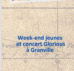
Week-end jeunes et concert Glorious à Granville