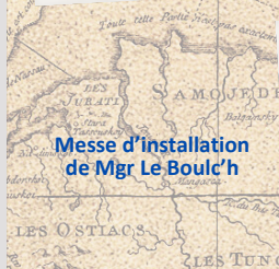
Messe d'installation de Mgr Le Boulc'h