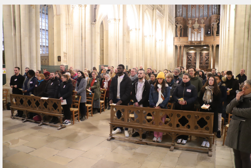
Appel décisif 2024

Pendant un, deux ans ou plus, à leur rythme, ces futurs baptisés ont découvert, par le témoignage de leurs accompagnateurs, la lecture de la Parole de Dieu, la prière personnelle et communautaire, la solidarité : la joie d'être chrétien. Ils ont fait l'expérience de la foi, en faisant confiance à Dieu, mais aussi aux hommes. Cette confiance les a conduits à vivre une attitude chrétienne forte.