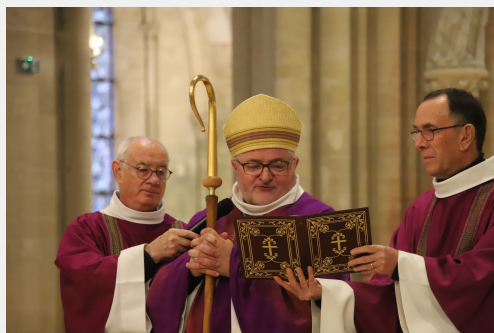
Appel décisif 2024