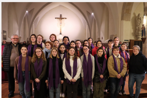
Appel décisif 2024