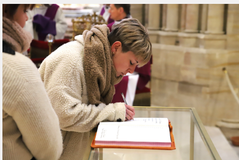
Appel décisif 2023