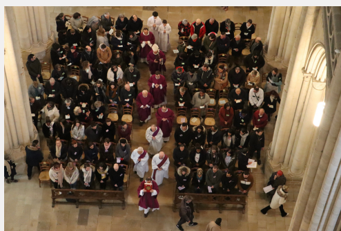
Appel décisif 2023