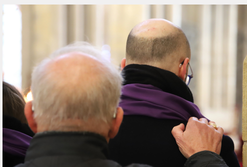
Appel décisif 2023

Pendant un, deux ans ou plus, à leur rythme, ces futurs baptisés ont découvert, par le témoignage de leurs accompagnateurs, la lecture de la Parole de Dieu, la prière personnelle et communautaire, la solidarité : la joie d'être chrétien. Ils ont fait l'expérience de la foi, en faisant confiance à Dieu, mais aussi aux hommes. Cette confiance les a conduits à vivre une attitude chrétienne forte.