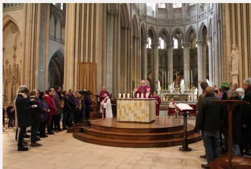
Appel décisif 2018

Pendant un, deux ans ou plus, à leur rythme, ces futurs baptisés ont découvert, par le témoignage de leurs accompagnateurs, la lecture de la Parole de Dieu, la prière personnelle et communautaire, la solidarité : la joie d'être chrétien. Ils ont fait l'expérience de la foi, en faisant confiance à Dieu, mais aussi aux hommes. Cette confiance les a conduits à vivre une attitude chrétienne forte.