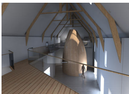
PLAN D'ARCHITECTE Johanna Schmidt