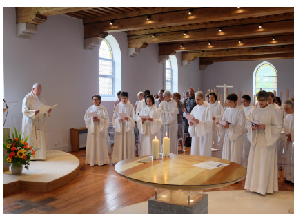
SOEURS DU CARMEL SAINT-JOSEPH

Le Carmel Saint-Joseph, fort de sa spiritualité spécifique, aura pour mission la poursuite des travaux, l'avancée du travail de recherche pédagogique et l'élargissement du rayonnement de la Grange.