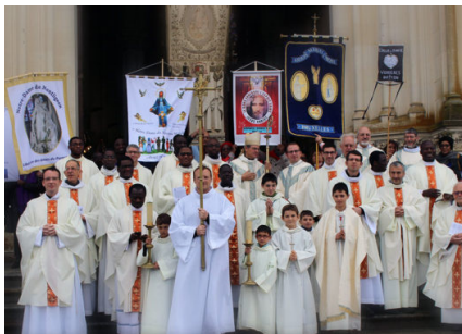
LA COMMUNAUTÉ À MONTLIGEON