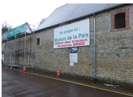
GRANGE DE LA PAIX

À Sainte-Mère-Église, chaque année, plusieurs centaines de milliers de visiteurs découvrent les vestiges de la guerre. Comment accompagner ce mouvement pour qu'il n'en reste pas à une vision passéiste, mais qu'il soit à la source d'un renouveau d'engagement au service de la construction de la paix ? C'est de cette interrogation qu'est né le projet de la Grange de la Paix. Depuis 2012, des religieuses de diverses nationalités et une quinzaine de bénévoles accueillent les milliers de touristes dans l'église de Sainte-Mère-Église. La communauté rayonne et témoigne de la paix de l'évangile pour tous. Les sœurs organisent également des rencontres, des conférences, des ateliers pour sensibiliser chacun à son rôle dans la construction de relations apaisées et fraternelles au quotidien. Lieu d'accueil et d'écoute, la communauté installée dans la Maison de la Paix tisse des liens de réconciliation sur le territoire local. Actuellement, les activités se déroulent la Maison de la Paix, lieu d'habitation des sœurs. Demain, c'est dans la Grange de la Paix, un espace de 270 m 2 , que les milliers de visiteurs de Sainte-Mère-Église seront accueillis pour vivre une expérience spirituelle forte.