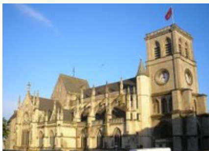
PAROISSE SAINT-JEAN-XXIII DE CHERBOURG - LA GLACIERIE