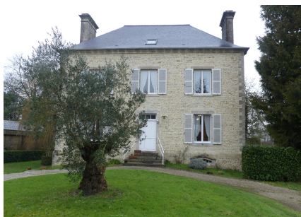
MAISON DE LA PAIX