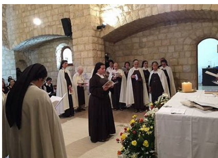
UNE SOEUR DU CARMEL SAINT-JOSEPH À SAINTE-MÈRE-ÉGLISE - P XX