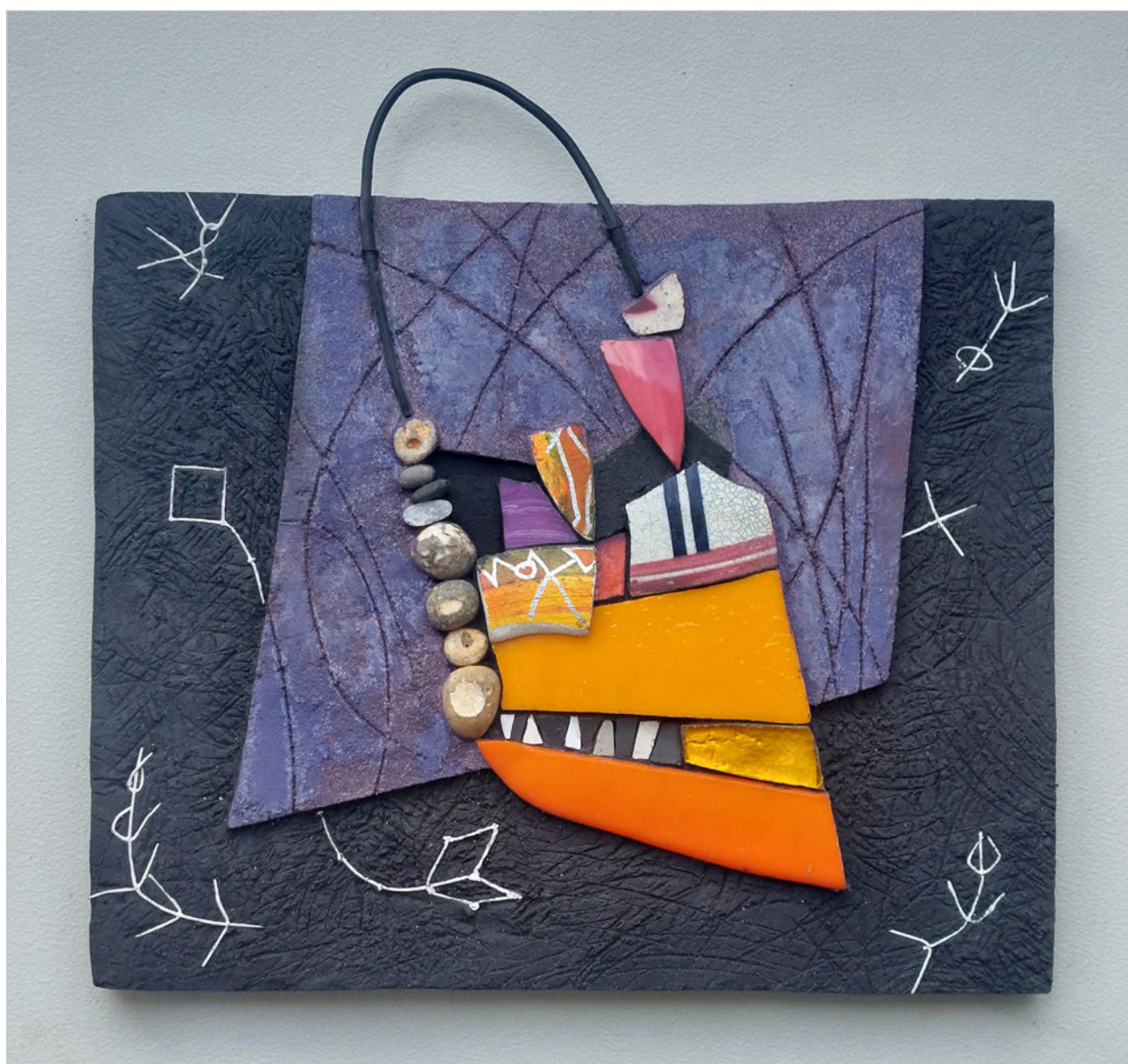
Dense, danse, d'anse

“Trésors de l’inaperçu transposés au cœur d’une œuvre subtile, émotions de l’artiste et du spectateur, voilà que tout s’accorde pour offrir une réjouissante polyphonie où la matière transfigurée s’élève comme un chant.”